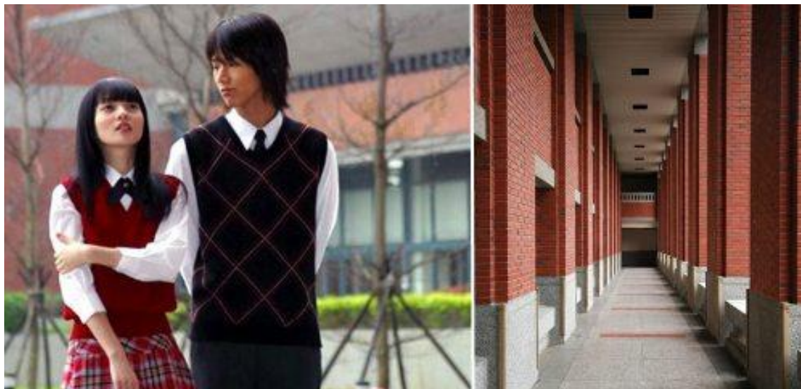
《流星花園》 1 、《愛殺17》 2 、等偶像劇到此拍攝