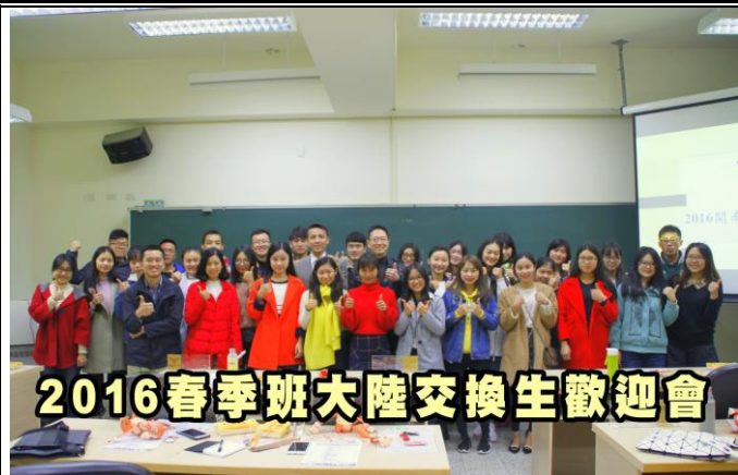
大陸交換生歡迎會